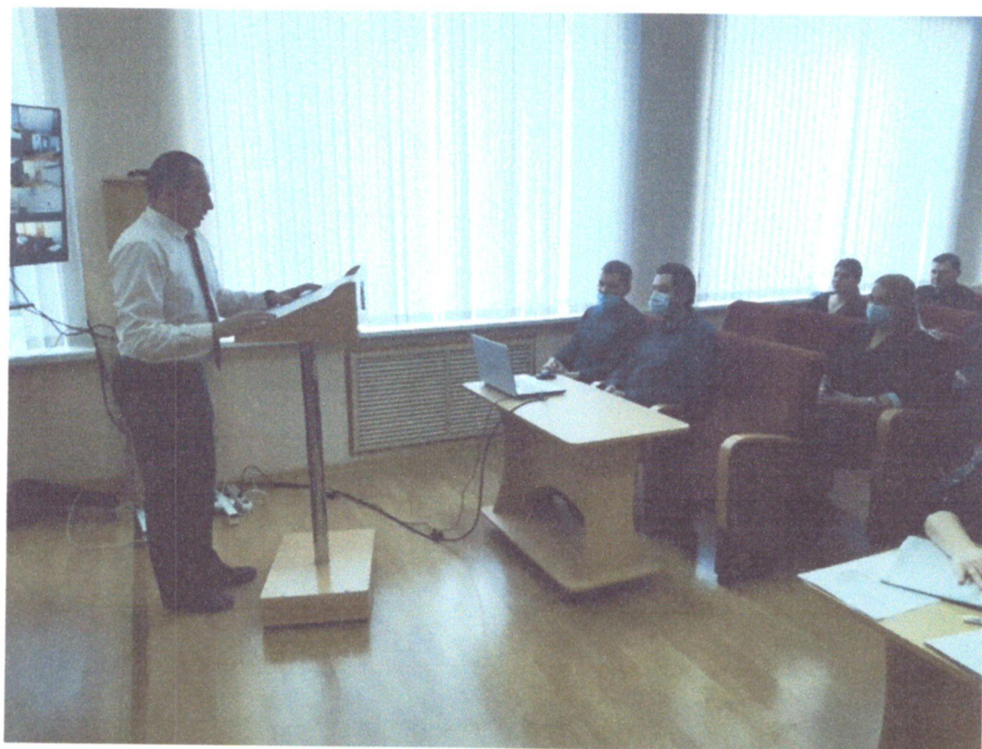
Фотоматериал заседания общественной комиссии от 21 января 2021 г.